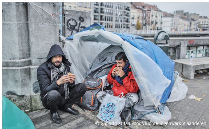
© Sanad Latifaa voor Vluchtelingenwerk Vlaanderen